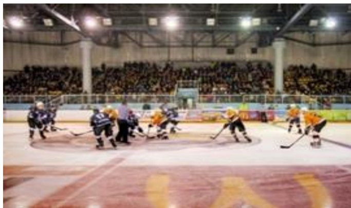
Ледовый Дворец | ул. Челюскинцев, д. 2а