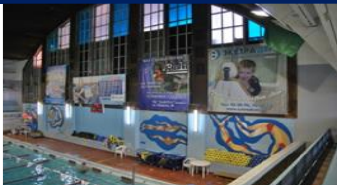
Плавательный бассейн | ул. Челюскинцев, д. 2